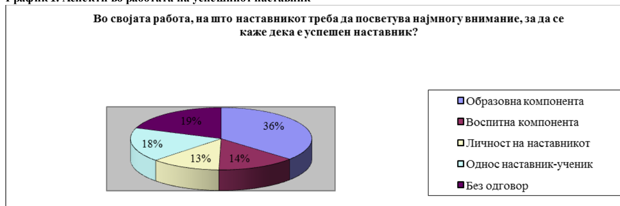
График 1. Аспекти во работата на успешниот наставник

Во контекст на остварување на воспитната работа на наставникот, важен аспект е и вреднувањето на постигнатите резултати, каде влијание имаат и одредени аспекти кои се поврзани и се резултат на воспитното делување на наставникот. Овде првенствено се мисли на однесувањето на учениците преку кое се манифестираат некои нивни лични карактеристики, како што се трудољубивост, мрзеливост и сл. Добиените одговори покажуваат дека околу 80% од испитаните наставници се изјасниле позитивно, односно дека истите имаат влијание дека во формирањето на оценката на учениците. (График 2) Сепак, овие одговори се во контрадикторност со резултатите на следното прашање (График 3), кои покажаа дека сепак, оценката како воспитно средство, односно како